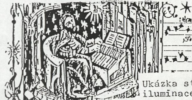
Ukázka středověké iluminace